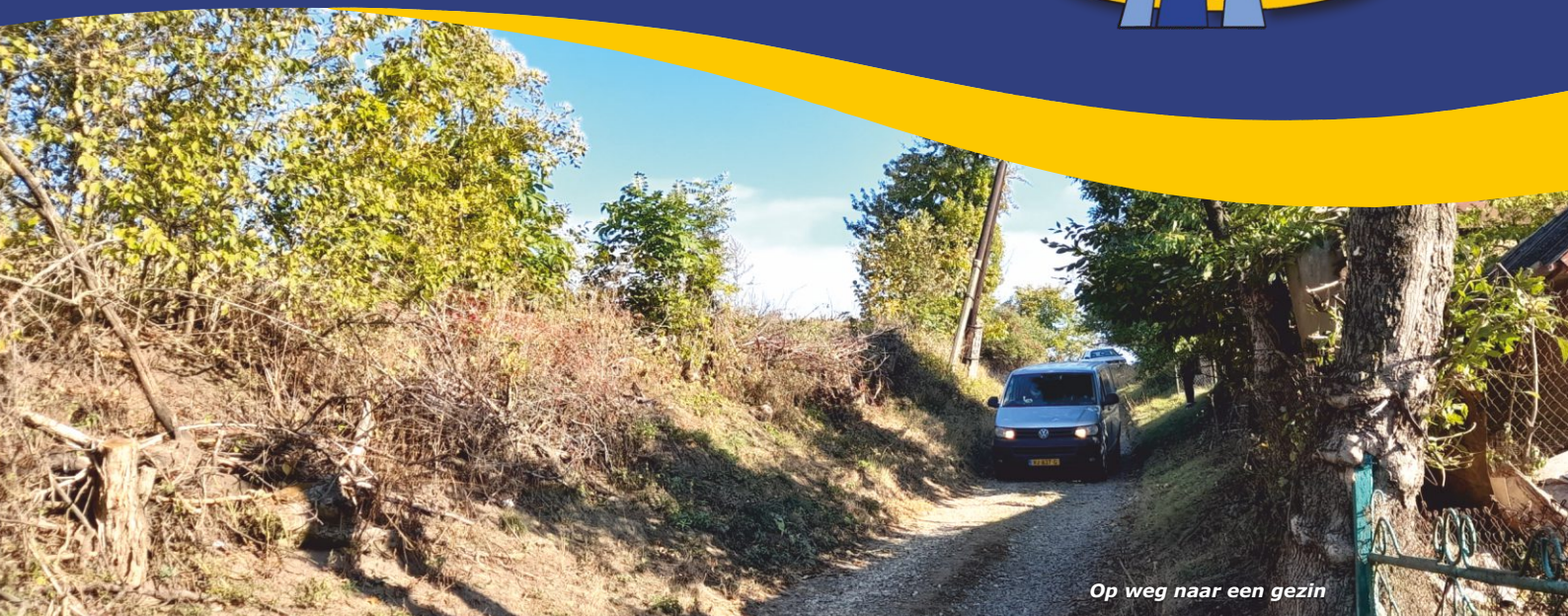
Op weg naar een gezin

"Laat toch Uw goedertierenheid er zijn om mij te troosten" - Psalm 119:76