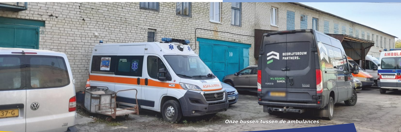
Onze bussen tussen de ambulances