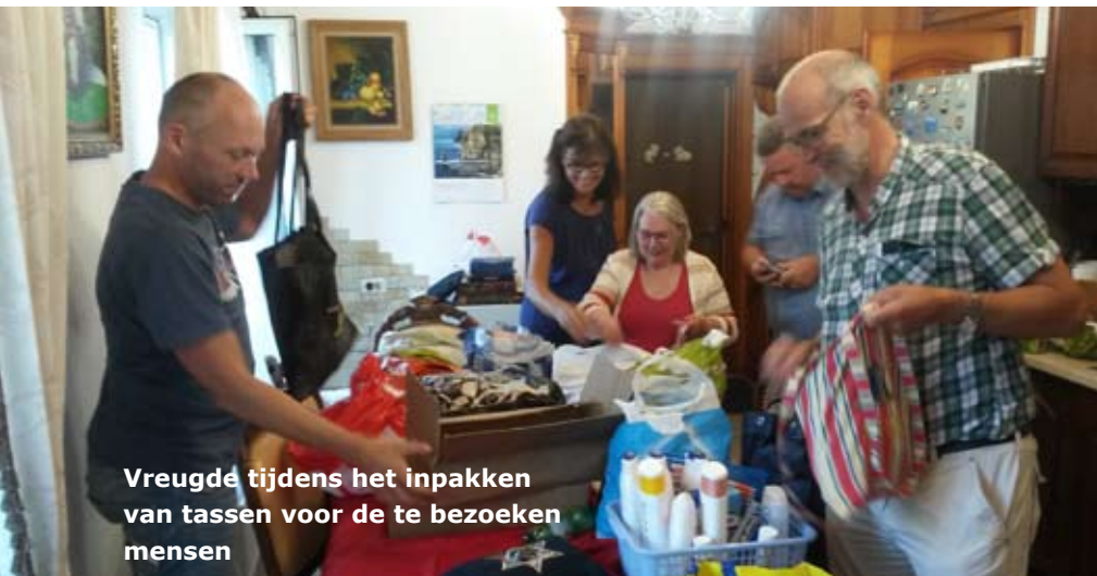
Vreugde tijdens het inpakken van tassen voor de te bezoeken mensen