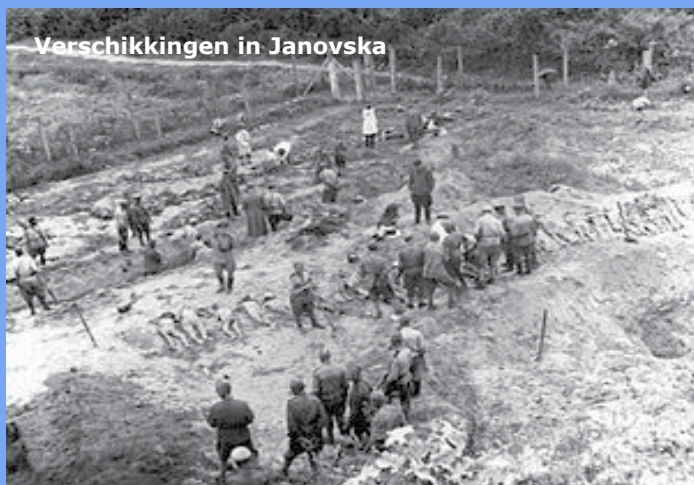
Verschikkingen in Janovska

pistolen. Een Oekraïner begon links van de rij; hij schoot de eerste Jood in zijn nek. Daarna volgde de tweede, de derde enz. Toen zijn pistool leeg was, liep hij naar de tafel, nam een flinke slok wodka en at van de worst en pakte een nieuw pistool. Twee Oekraïners smeten de lichamen in de klaarstaande kratten en brachten de doden weg. Het geluid van de schoten en het kreunen van de slachtoffers kwam steeds dichterbij. Nog even en het was mijn beurt. Opeens luidden de kerkklokken en een Oekraïners riep: "Genoeg, de avondmis." Het schieten hield direct op. Er waren nog ongeveer 20 Joodse mensen over, ook mijn vriend en ik-zelf." Die nacht heeft een Poolse vriend hem en zijn vriend uit de gevangenis weten te krijgen door te beweren dat zij beiden Russische spionnen waren en een andere 'behandeling' moesten krijgen. Wiesenthal ontsnapte zo nog een paar keer aan de dood. God had met hem heel duidelijk een plan. Na de oorlog zou hij uit naam van alle slachtoffers, waaronder 85 familieleden van hem en zijn vrouw, strijden voor recht. Er moest recht gedaan worden, door de daders van de gruwelijke misdaden voor de rechter te krijgen. Het zou Wiesenthals levenswerk worden.