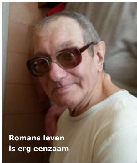
Romans leven is erg eenzaam