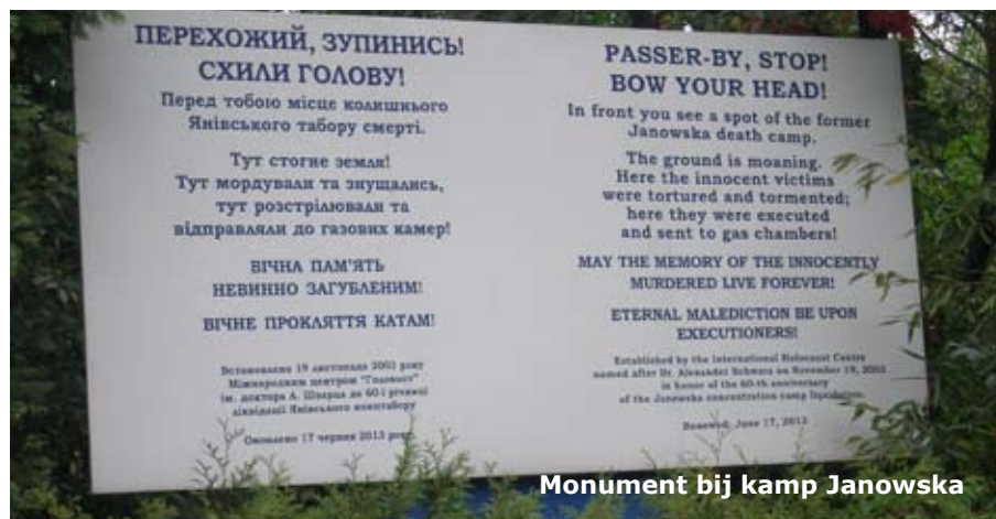
Monument bij kamp Janowska