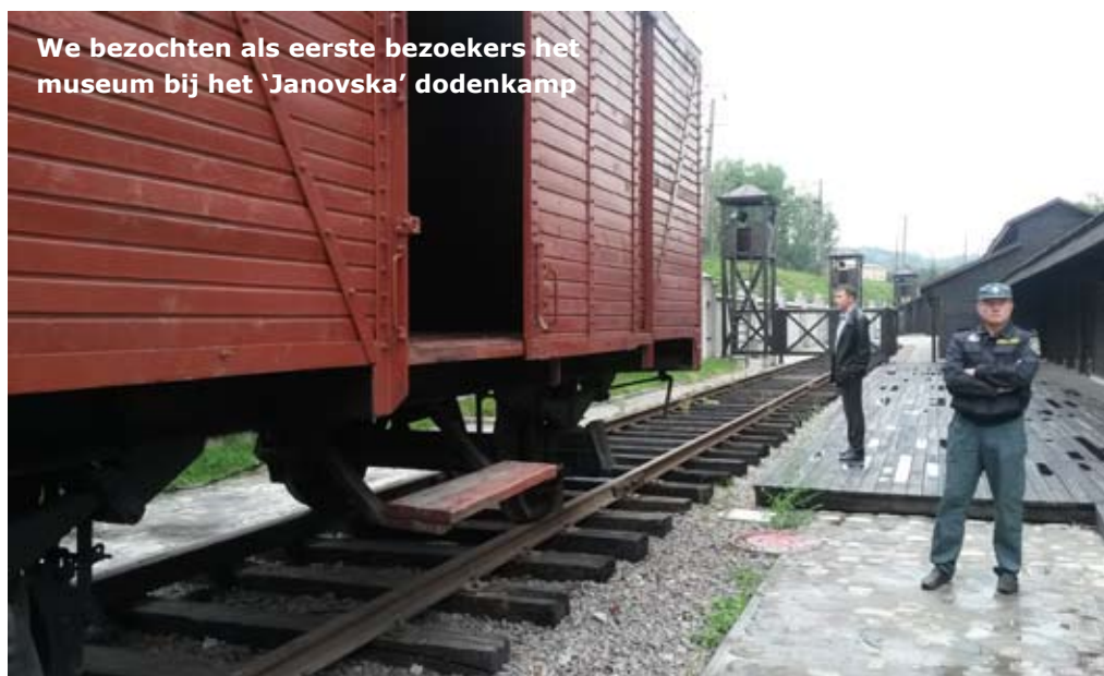
We bezochten als eerste bezoekers het museum bij het 'Janovska' dodenkamp

De barakken waren nog leeg, er zal een tentoonstelling in komen. Langs de muur van de afscheiding komen zoveel mogelijk namen van Joodse