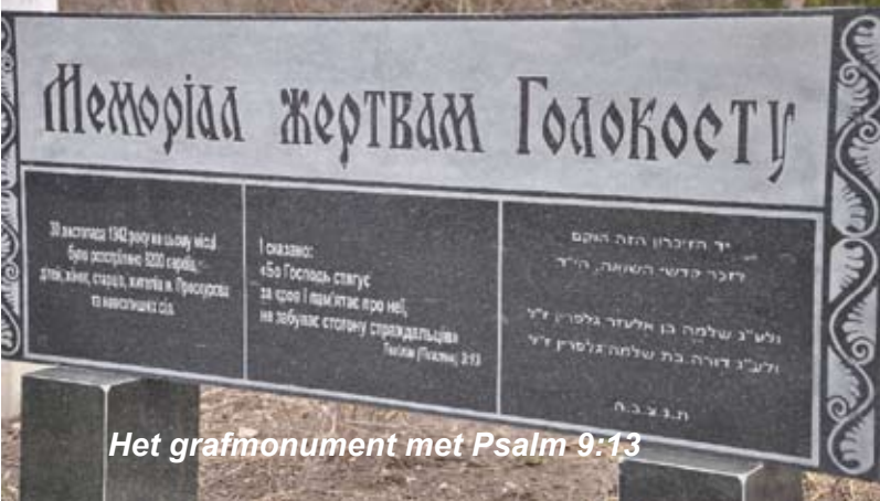
Het grafmonument met Psalm 9:13