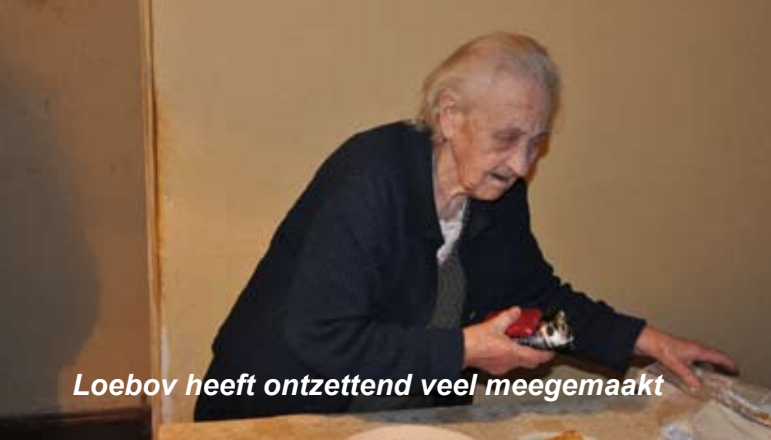
Loebov heeft ontzettend veel meegemaakt

"Ik ben van 1921, ik heb twee oorlogen overleefd. Ik werd in WOII een wees."