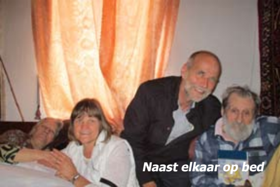
Naast elkaar op bed