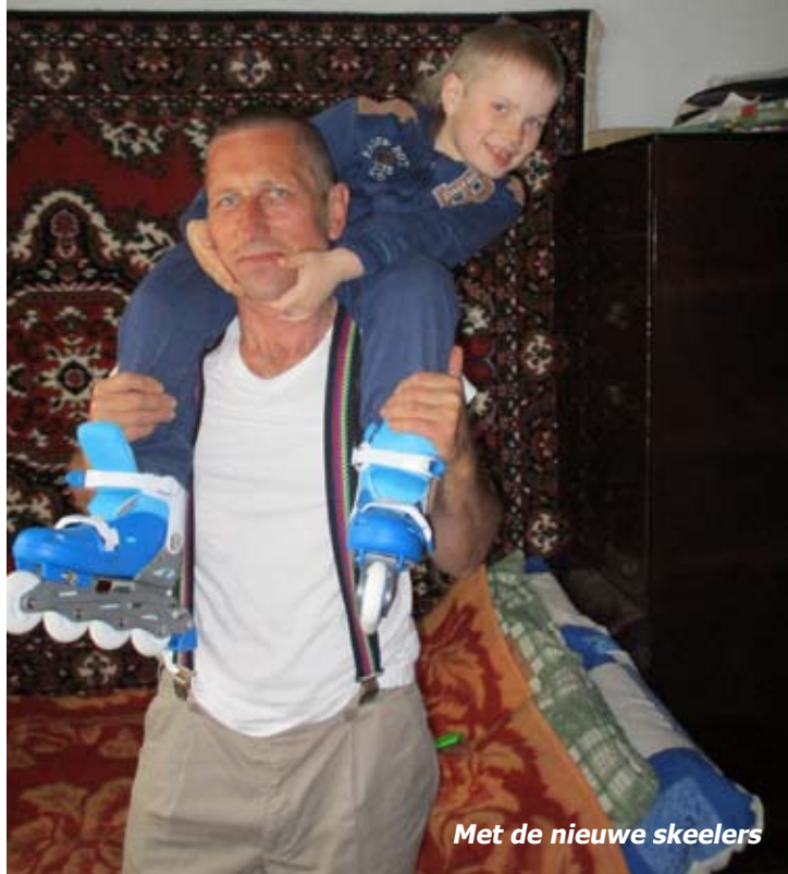
Met de nieuwe skeelers