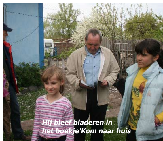
Hij bleef bladeren in het boekje 'Kom naar huis'