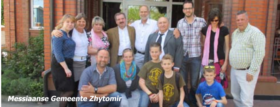
Messiaanse Gemeente Zhytomir