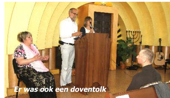
Er was ook een doventolk