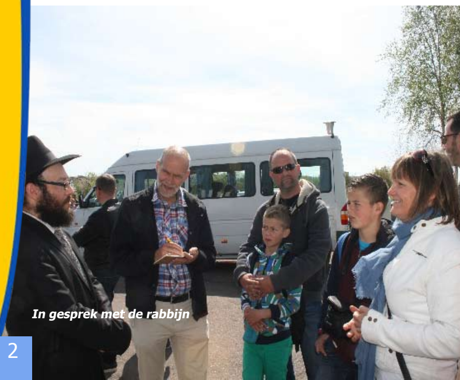
In gesprek met de rabbijn

In Rovne is dus hetzelfde gebeurd: "Op 28 juni 1941 werd Rovne door de nazi's veroverd. De stad werd zelfs tot centrum van het Reichskommissariat Oekraïne gemaakt. Op het moment van de inname was ongeveer de helft van de stad Joods. De Joden in de stad werd gevraagd op 6 november zich te verzamelen op een ontmoetingsplaats in de stad. Zij dachten geen kwaad, het was immers nog het begin van de oorlog. Ook hoefden niet alle Joden te komen; artsen, juristen en advocaten konden nog blijven. De overigen werden meegenomen naar de bossen van Sosenski aan de rand