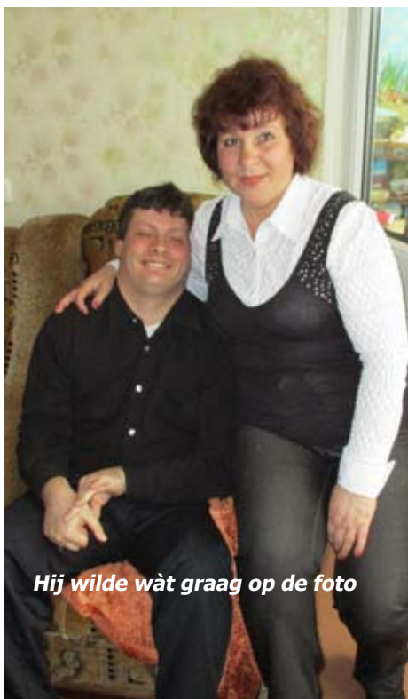
Hij wilde wát graag op de foto