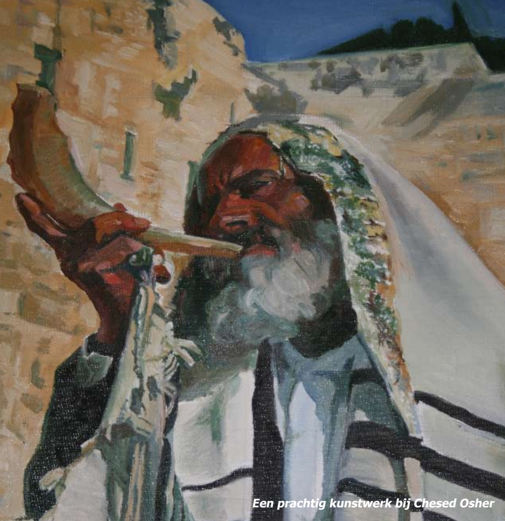
Een prachtig kunstwerk bij Chesed Osher

heel gelukkig was. We zongen en baden nog met hen en gaven hen de tas met spullen, en nog wat voedsel. We ontvingen van hen allemaal zegenende woorden.