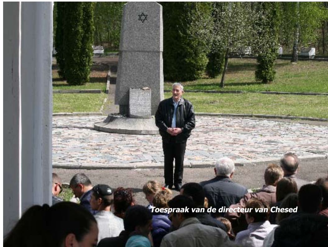
Toespraak van de directeur van Chesed