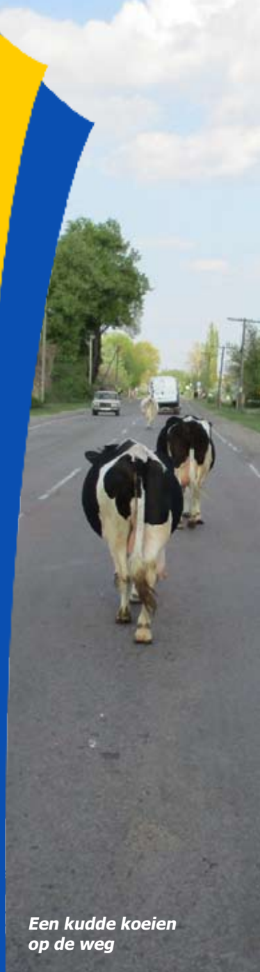
Een kudde koeien op de weg