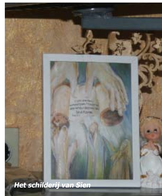
Het schilderij van Sien

“...ze getuigde van wat God in haar leven had gedaan...”