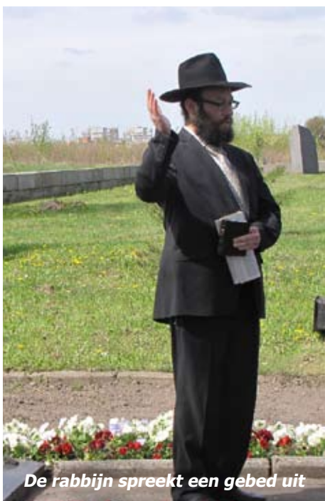
De rabbijn spreekt een gebed uit