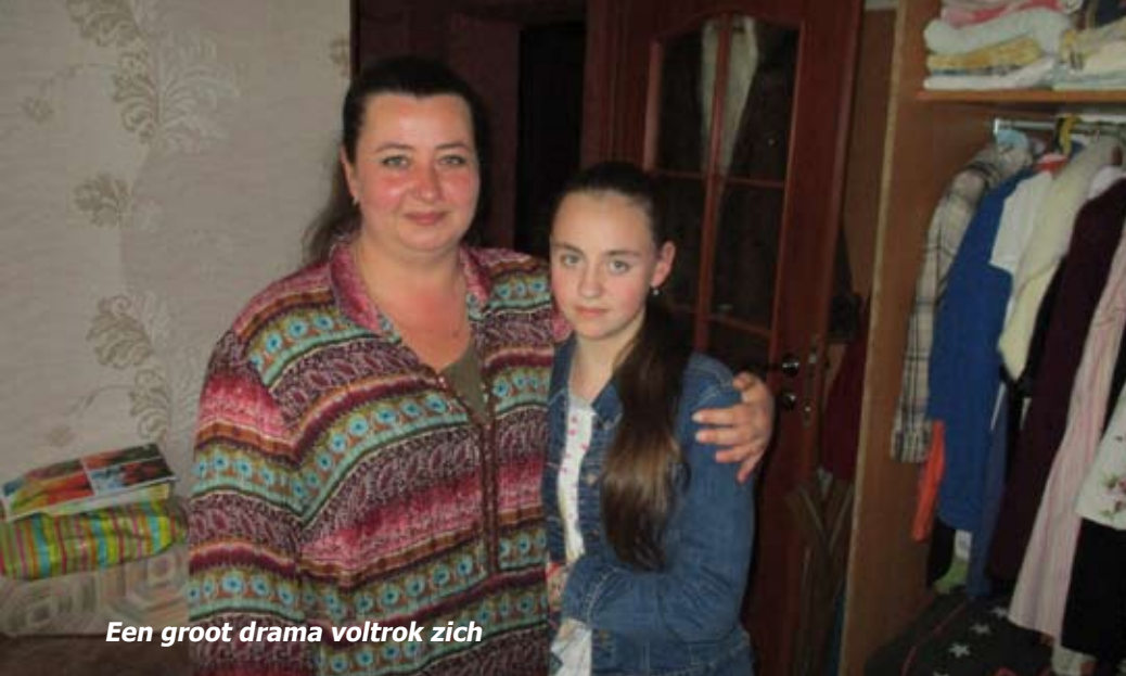
Een groot drama voltrok zich