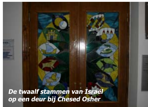
De twaalf stammen van Israël op een deur bij Chesed Osher

Ook de oorlog in het oosten, die nog steeds doorgaat, kwam ter sprake: "Elke dag begint het nieuws met het vermelden van het aantal doden en gewonden. Er zijn aan Oekraïense kant nu al 6500 doden gevallen van de Russische kant kan ik het niet zeggen." Het is wel duidelijk dat Rusland niet tevreden is met de Krim, maar dat zij ook een aanvoerroute over land willen creëren. Daar is de strijd nu op gericht: "Steeds vult Rusland het leger aan met manschappen en materieel. Er zijn al 15 tot 17 zogenaamde hulpkonvoeien vanuit Rusland binnengekomen, die door niemand gecontroleerd mogen worden. Na de komst van een konvooi nemen