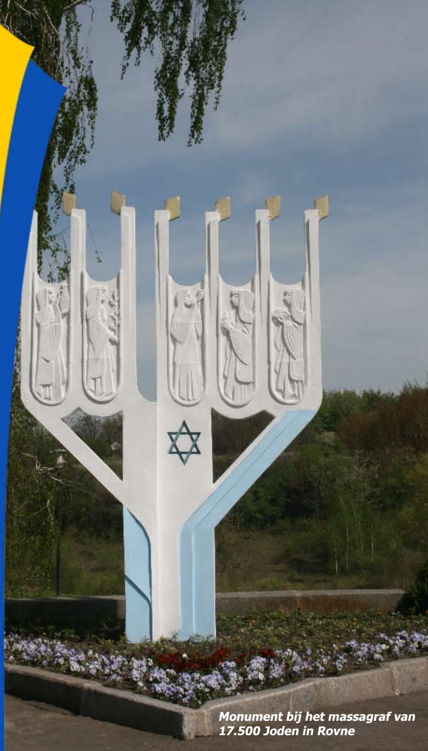
Monument bij het massagraf van 17.500 Joden in Rovne