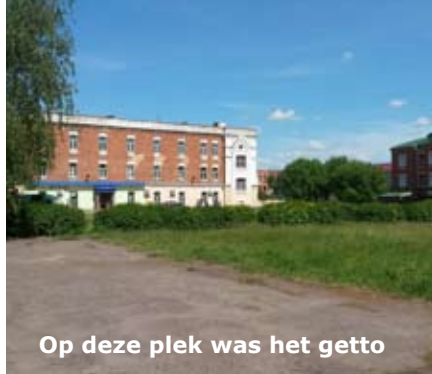
Op deze plek was het ghetto

naar de plek waar het ghetto was geweest. In dit stadje was vóór de oorlog meer dan 60% van de inwoners Joods. Wat over is, is een grote lege ruimte, afwisselend beton en gras en ook een plek met speeltoestellen. Om het gebied heen waren grotere gebouwen zichtbaar. Wat heeft zich hier een groot drama afgespeeld (zie blz. 11)