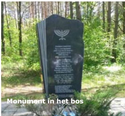
Monument in het bos

Na het eten gingen we naar een paar Joodse gedenkplaatsen, in deze omgeving. Sasja bracht ons er naar toe. Allereerst naar het monument dat herinnert aan de brute moord op 3000 Joden uit het ghetto van Berioza, een klein stadje vlakbij Belaozjorsk. De Joden werden op 16 oktober 1942 in het ghetto opgepakt en de stad uitgedreven en op deze plaats in een massagraf doodgeschoten (zie blz. 10,11) We reden naar het stadje Berioza,