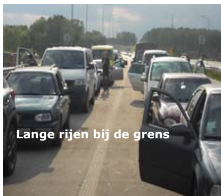
Lange rijen bij de grens