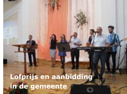
Lofprijzen en aanbidding in de gemeente