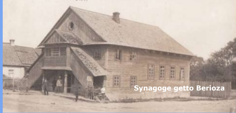
Synagoge getto Berioza

Op 26 juni 1941, vier dagen na het begin van de oorlog, verschenen de Duitsers al in Berioza. De Joden werden licha-