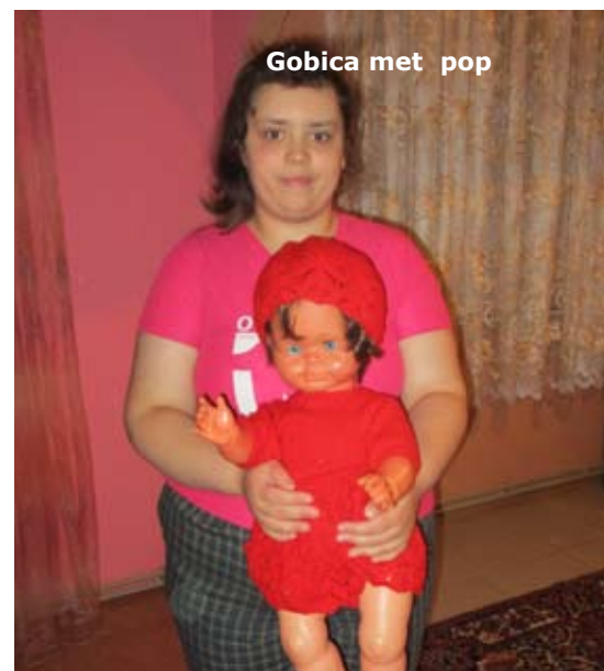
Gobica met pop