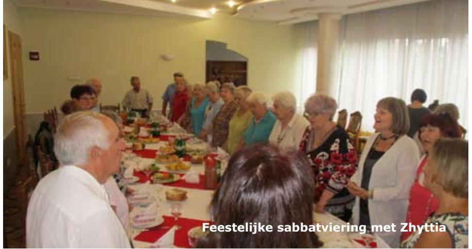
Feestelijke sabbatviering met Zhyttia